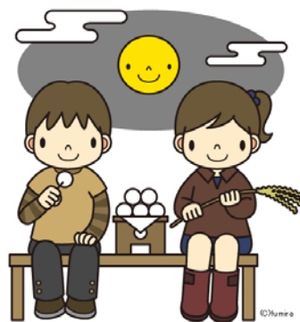
今年の十五夜（中秋の名月）は、10月3日です。